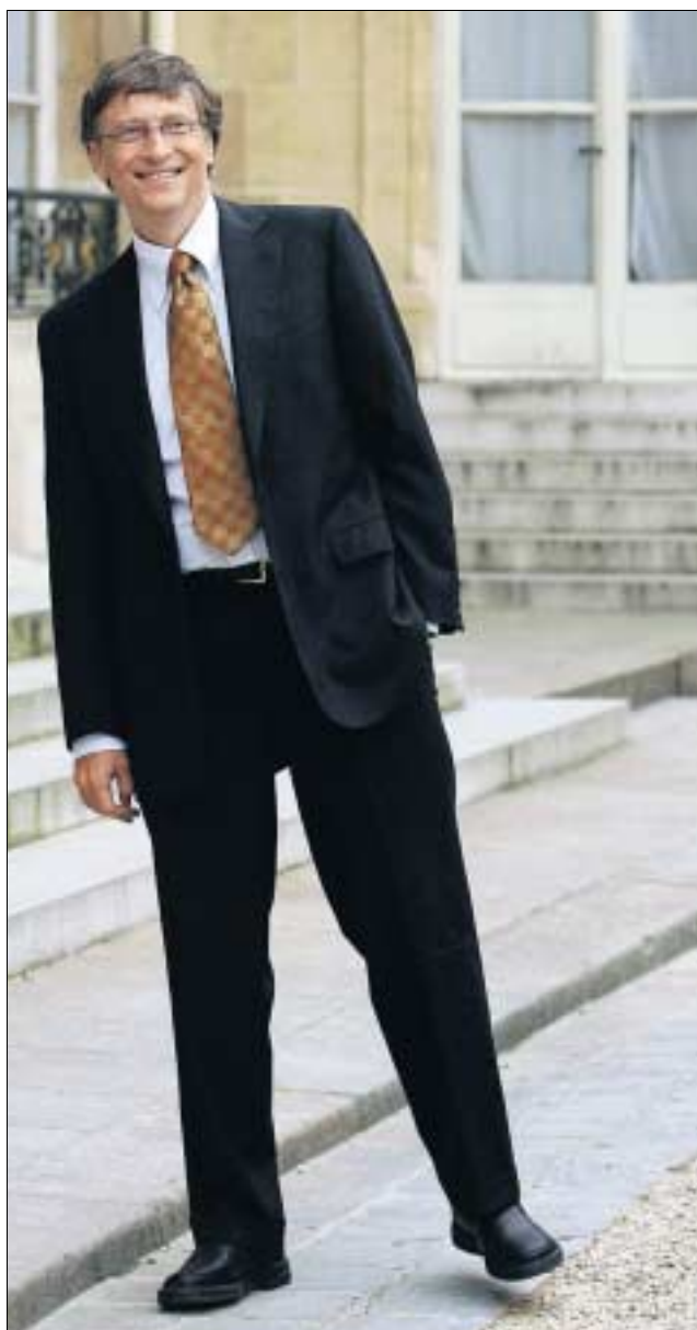
Zwei Männer, zwei Imperien: Apple-CEO Steve Jobs und Microsoft-Gründer Bill Gates.