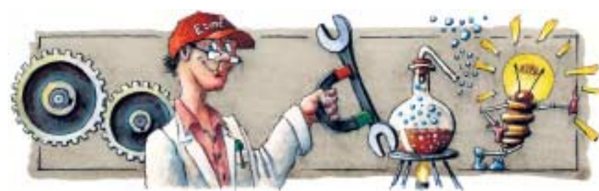
ILLUSTRATION: RENÉ LEUTENEGGER